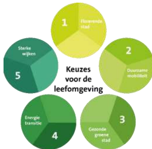
Afbeelding 3: de keuzes voor de leefomgeving