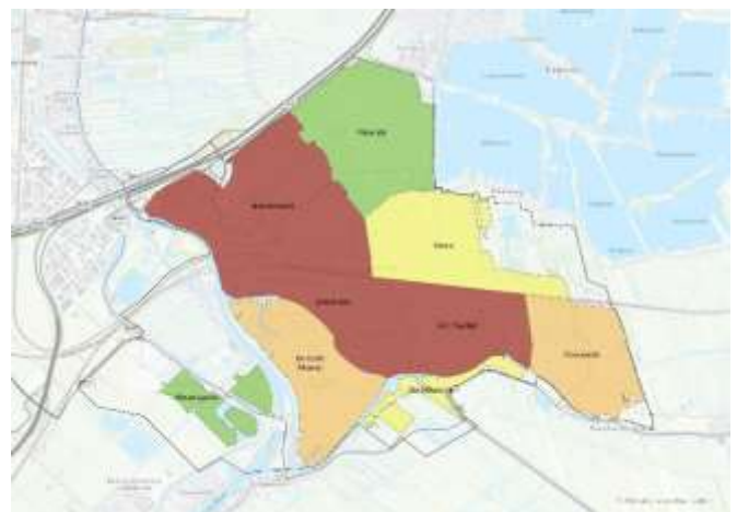
Afbeelding 4: Totalscore thema klimaat Goudse wijken.

Als je allebei de onderdelen samen bekijkt, zijn de wijken Plaswijck en Westergouwe de enige die op niveau zijn (groen). De meest kwetsbare wijken zijn de Binnenstad, Bloemendaal en Kort Haarlem (rood). Dit komt omdat er hier veel versteende gebieden zijn. Dit is terug te zien op afbeelding 4.