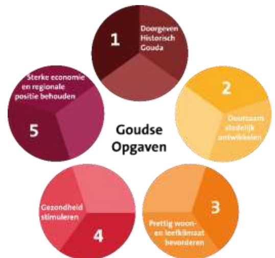
Afbeelding 2: de 5 Goudse Opgaven