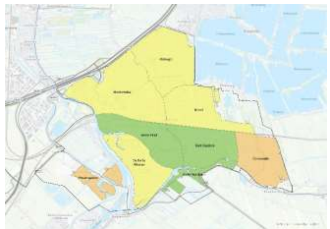
Afbeelding 6: Totaalscore thema ruimtelijke kwaliteit Goudse wijken.

Wij hebben bovenstaande onderdelen samengevoegd tot 1 kaart. Goverwelle en Westergouwe zijn de meest kwetsbare wijken (oranje). Westergouwe is nog in ontwikkeling, dus dit kan nog veranderen. De Binnenstad, Kort Haarlem en Stolwijkersluis zijn het minst kwetsbaar op het gebied van ruimtelijke kwaliteit (groen). Alle resultaten zijn terug te zien op afbeelding 6.