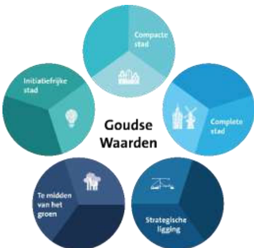
Afbeelding 1: de 5 Goudse Waarden

Vanwege de nieuwe Omgevingswet is de Omgevingsvisie Gouda ontstaan. Met deze Omgevingsvisie willen we zorgen dat Gouda een fijne stad is om in te wonen. Ook moet de stad klaar zijn voor de uitdagingen van de toekomst. Denk bijvoorbeeld aan klimaatverandering. In de Omgevingsvisie staan 5 Goudse Waarden, 5 Goudse Opgaven en 5 keuzes voor de leefomgeving (zie afbeelding 1, 2 en 3 hieronder). 1 van de 5 Goudse Waarden is 'te midden van het groen'. We willen dus dat Gouda middenin het groen ligt. Daarnaast is 1 van de Goudse opgaven een prettig woon- en leefklimaat bevorderen. We willen dit voor alle inwoners van Gouda. De focus ligt hierbij op aantrekkelijkere en groenere openbare ruimte.